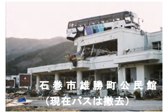
石巻市雄勝町公民館 (現在バスは撤去)