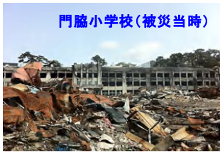
門脇小学校(被災当時)

3. 11の未曾有の大震災を忘れることなく、また後世に伝えるため、皆様のその目で被災地をご確認下さい。そしてその被災地を少しでも元気付けられるように、宿泊し、買い物をしていただく『被災地応援ツアー』です。