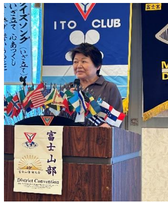
監事のピンチヒッターをやる直前部長前原Y's