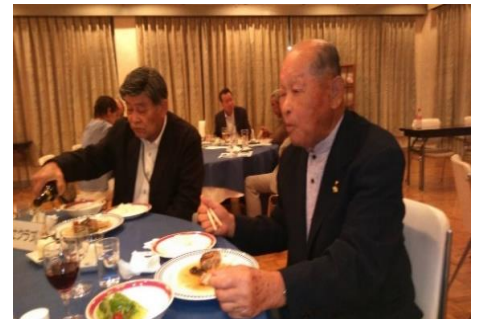
杉山将己Y's、美味しそうですね。