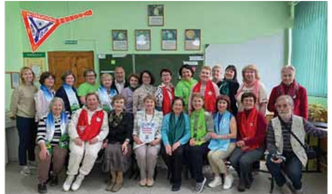
区イベントの参加者たち

その日の終わりに催される文化プログラムでは、一服の新鮮なエネルギーが供給されます。バレエ愛好家は、バシキール・オペラバレエ劇場でコルセア(「海賊」)を鑑賞します。ウファの観光ツアーが組まれ、船から見た街を称賛する機会