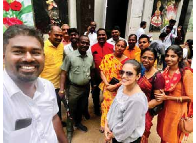
行進の先頭に立つクラブメンバー