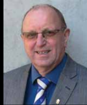
フィン・ペダーソン元国際会長 第86代国際会長 - 2011/12