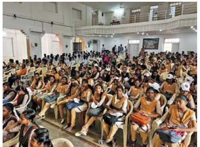
啓発セッションに参加する学生たち