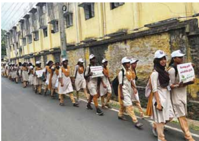
キャンペーンに参加するS.T.ヒンドゥー大学の学生たち