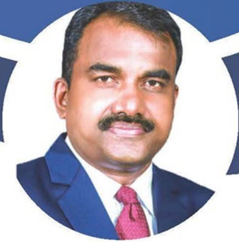
国際書記長 ジョース・ヴァルギース

エクステンションと会員維持/増強の強調月間である9月、私たちは、共に成長し、親睦と影響力において卓越した存在となることを楽しみにしています。