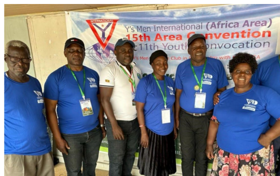
第15回アフリカ地域大会、第11回アフリカ地域AYC テーマ「暗い世の中に、あなたの光を輝かせよう」