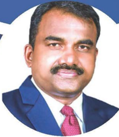
国際書記長 ジョース・ヴァルギース

11月は、ビルディングフェロシップ (BF) の強調月間です。2024/25年度にBFアンバサダー (BF代表) のホストクラブとなることをご検討いただけませんか？ BFプログラムの成功は、クラブとその会員の熱心な参加にかかっています。貴地域のBF訪問日程表を作成するにあたり、各区と調整することをお勧めします。ホストの申請の提出期限は2023年12月1日です。申請は、 BFホスティングフォーム を用いてください。