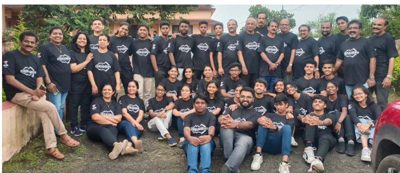
中央トラヴァンコール区ユースキャンプ (インド地域)