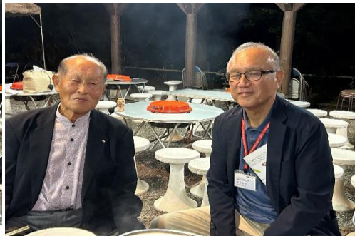
御殿場のメンバーも楽しそうですね