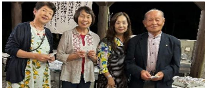
お誕生日おめでとうございます