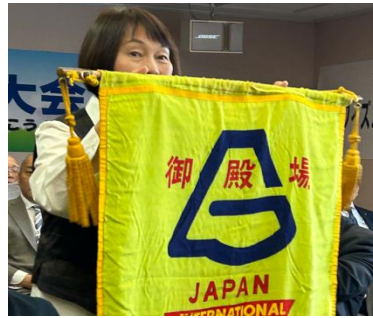
御殿場バナー登場