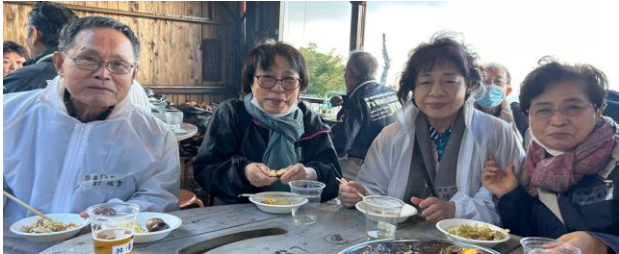
奈良の皆様、富士山で味わうお肉のお味はいかがでしたか？