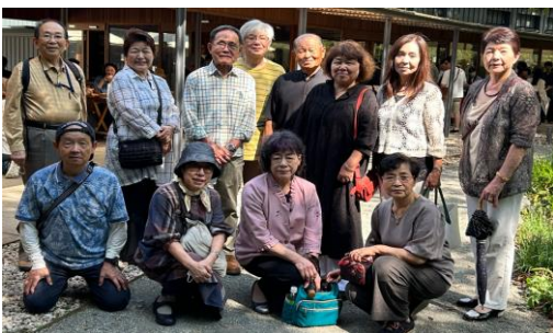
「とらや工房」前で記念写真

2日目は、東山荘を10時に出発し、まず旧岸邸に行きました。ボランティアガイドの建物内の説明に、奈良クラブの皆様は熱心に耳を傾けていました。邸宅の隣りにある「とらや工房」でお茶と和菓子で一休み、この日は日曜日ということもあり混雑を予想していた当クラブのメンバーは、邸内を案内する係、席取りをする係と二手に分かれたのが予想的中で、奈良の皆様をお待たせすることなく、スムーズに、そしてゆっくりお茶をさせていただきました。昼食は「藍や」さんのご配慮で個室を用意してくださいましたので、のんびり気兼ねなく交流ができたと思います。最後に奈良クラブの皆様から一言ずつ感想をいただきました。皆様口をそろえて「楽しかった」と仰っていただき、御殿場のメンバーは「ホット」胸をなで下ろしました。そして、「今回出席できなかった東海クラブに、楽しかった旨を知らせしますね。」との事。次の当番は東海クラブです、皆揃って元気に出席しましょう。