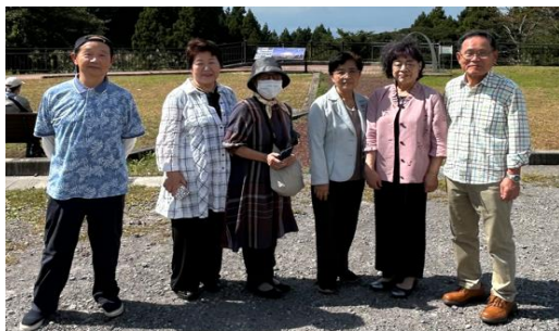
富士山が見えず「残念」でした。