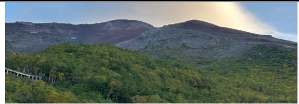
バーベキュー場駐車場から見た富士山山頂です。