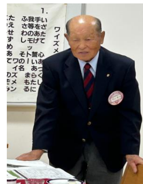
食前感謝・杉山将己Y's