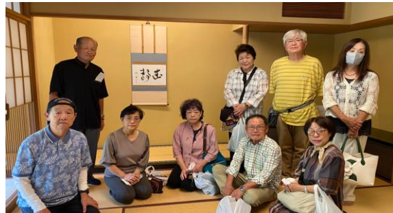
岸信介氏使用の和室。この後、前のおいで。和菓子を食べました。