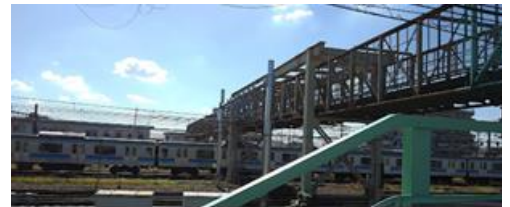
太宰治が愛した三鷹跨線橋

これらの情報を全て読み込むことはかなりの時間労力を要しますから興味のあるテーマ・話題に絞るなど工夫も必要でしょう。また話題によっては情報を共有することもクラブ活性化に必要かもしれません。