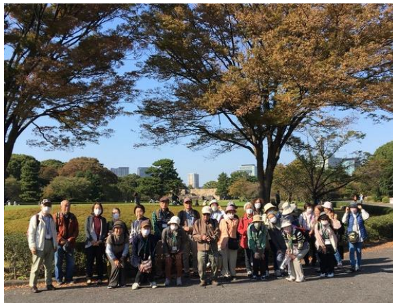
「天守台」が望める芝生広場