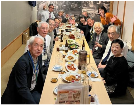
関東東部大会のあと、場所を変えて DBC 連合の交換会が開かれた