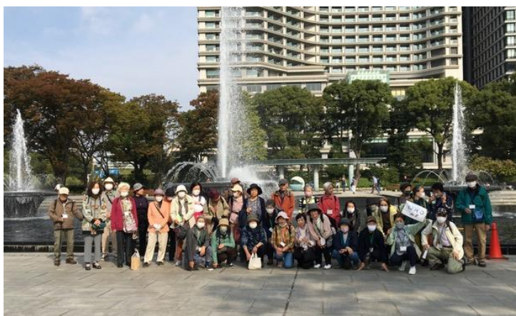
4か月ぶりのWHO・和田倉噴水公園にて