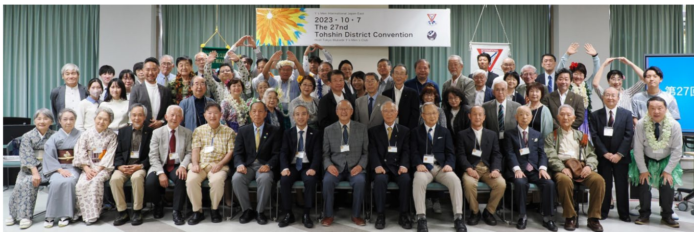
(第27回東新部部大会集合写真)

「これからのワイズを一緒に考えませんか」(東京むかでクラブ伊丹ワイズ/会員増強主査、当時)この言葉に惹かれて入会し、以来、クラブや部、区、西日本区においても多くの先輩方のお導きに恵まれました。この場を借りて御礼申し上げます。