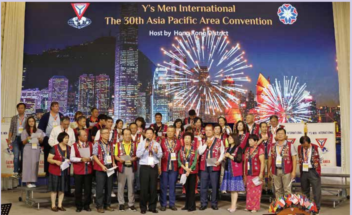
Singing, Taiwan Regional Performance