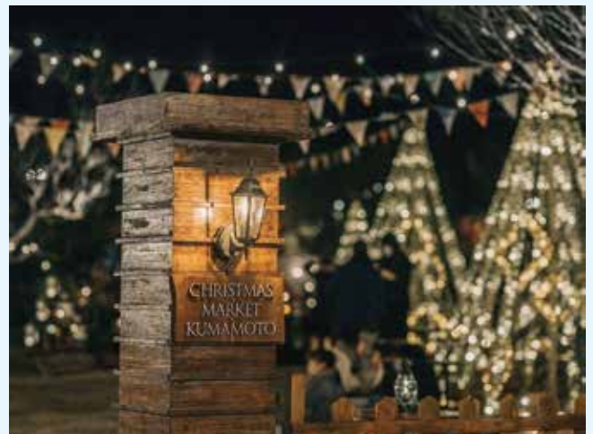
Christmas Market Kumamoto