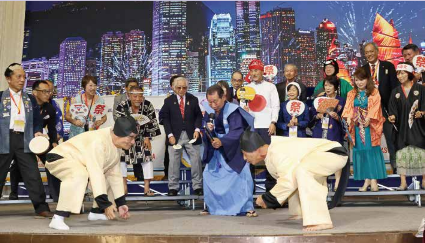
Sumo, Japan West Regional Performance