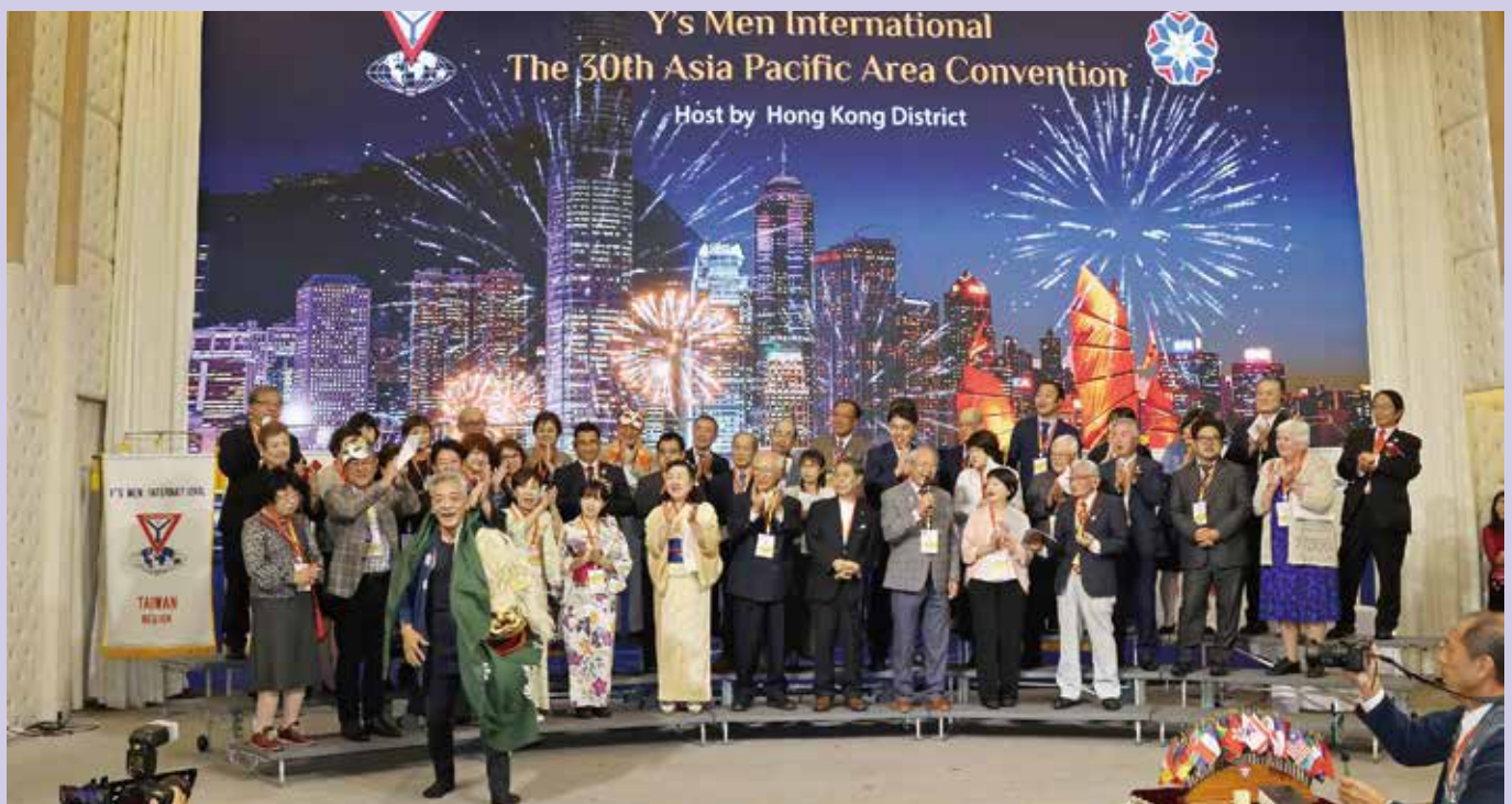
Shishimai, Japan East Regional Performance