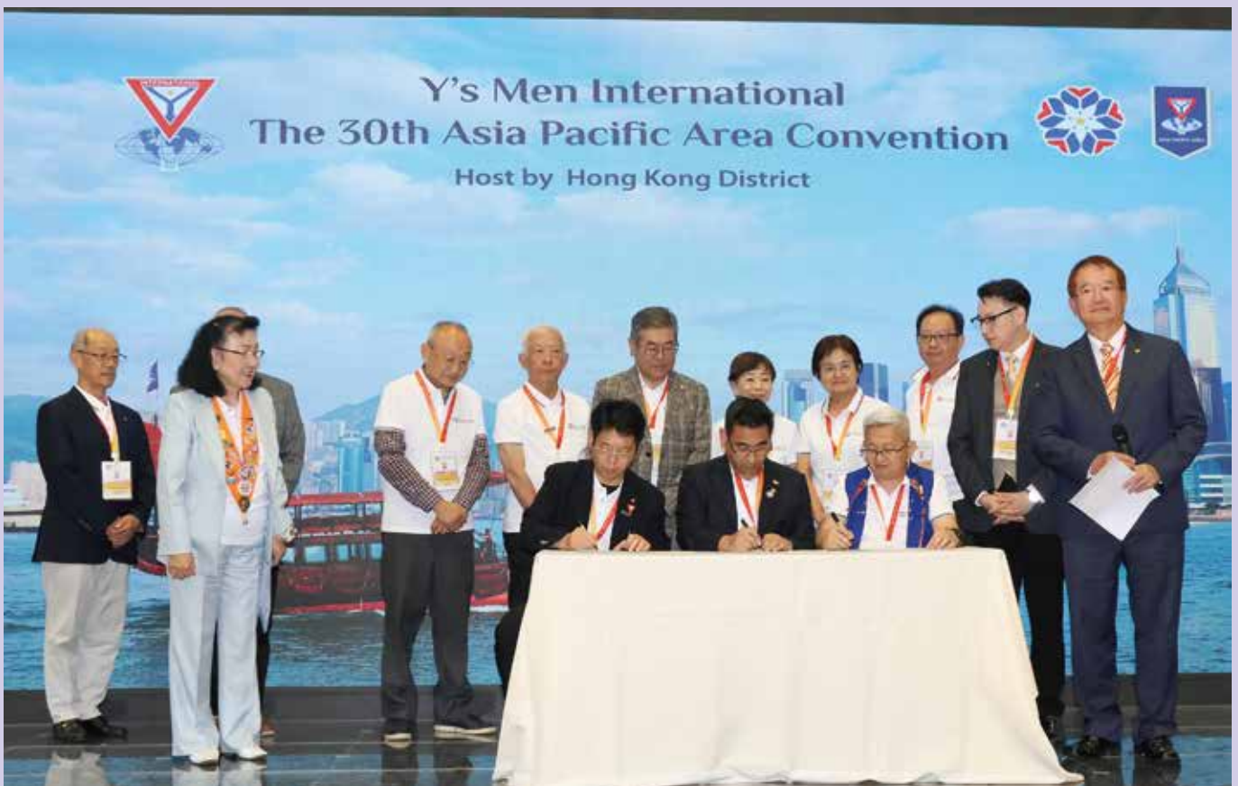
YMC Tokorozawa & Kawagoe, Japan and YMC Pangasinang, Philippine Signing IBC