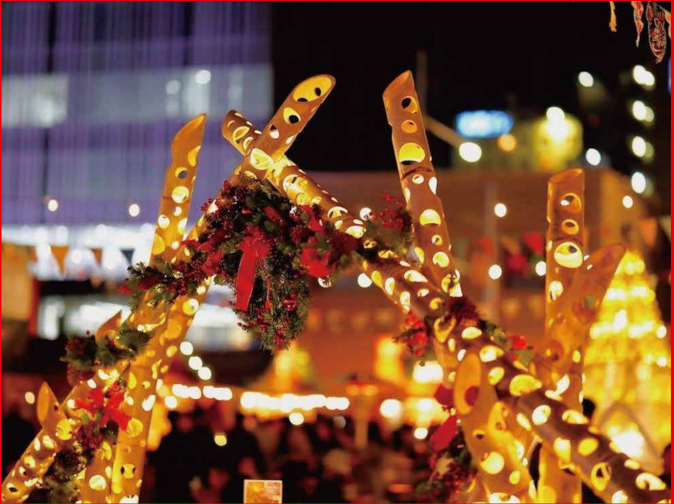
These Christmas decorative lights are made of bamboo.