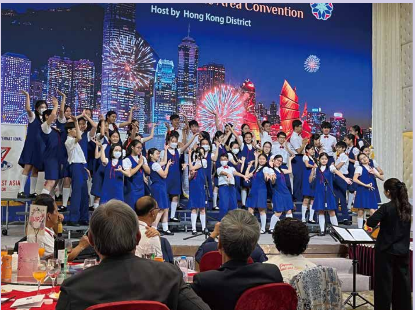
Hong Kong Children' s Choir