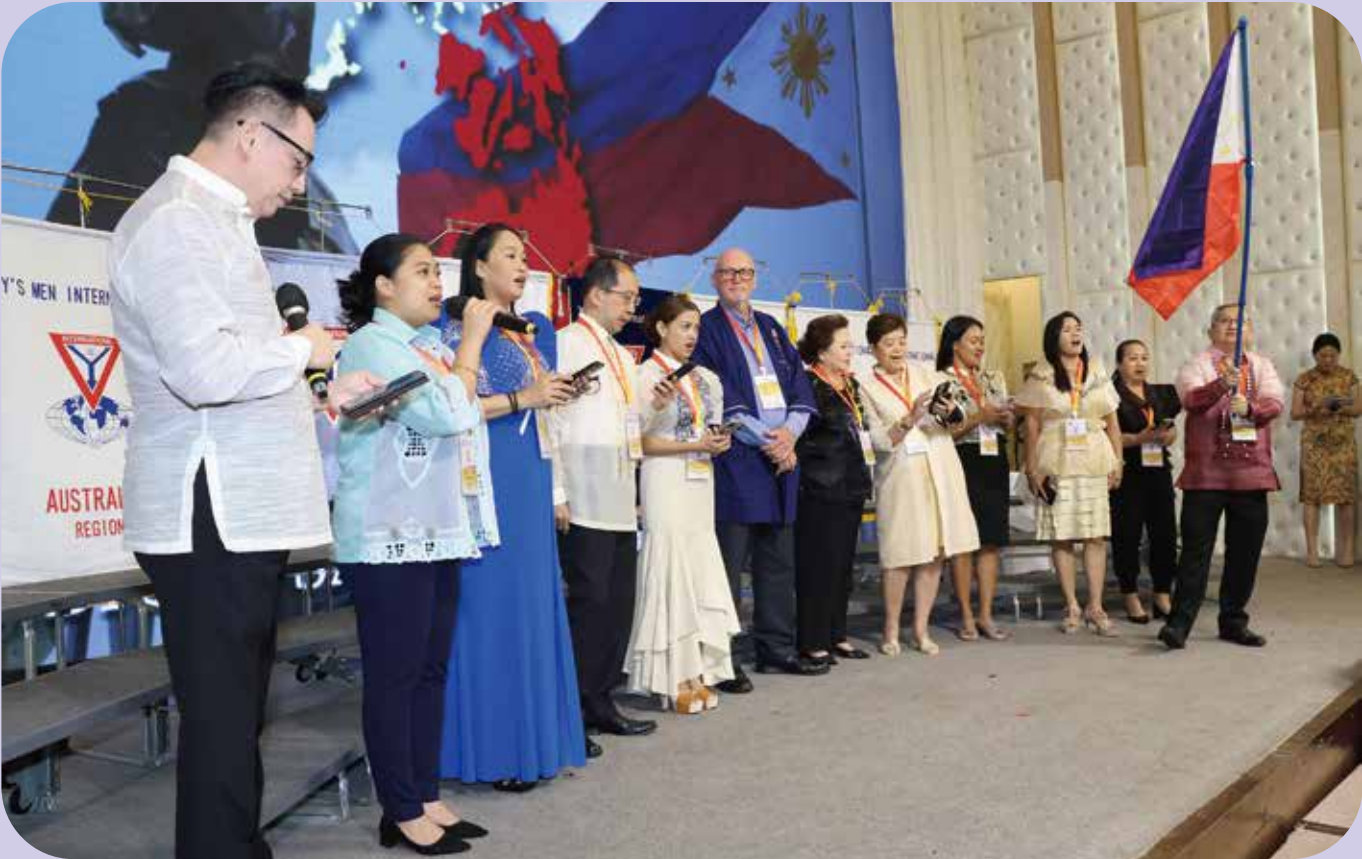
Singing, Philippine & Australia Regional Performance