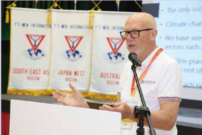
Fund Raising Appeal for Green Activities