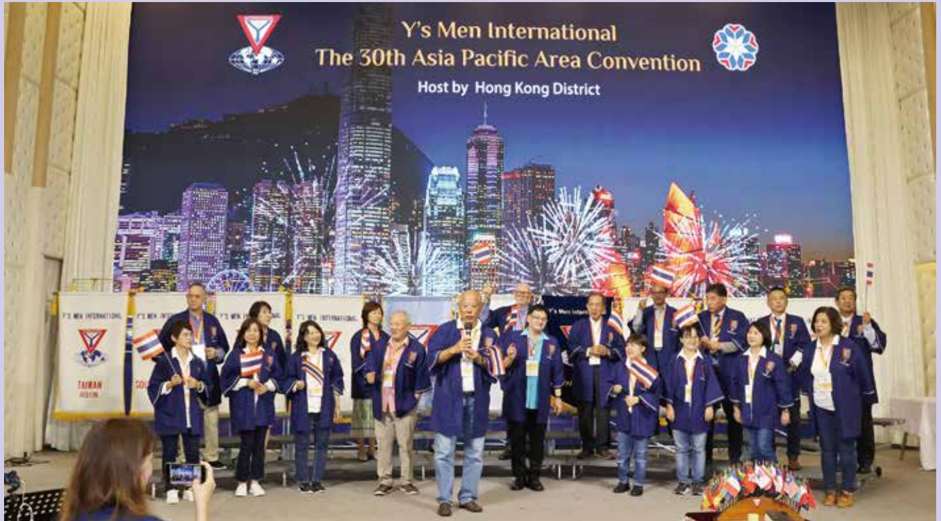
YMI Festival Promotion