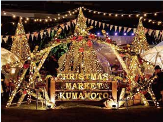
Christmas Market Kumamoto