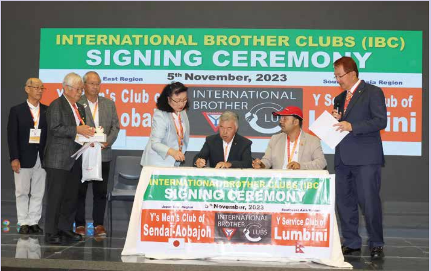
YSC Lumbini, Nepal & Sendai-Aobajoh, Japan Signing IBC