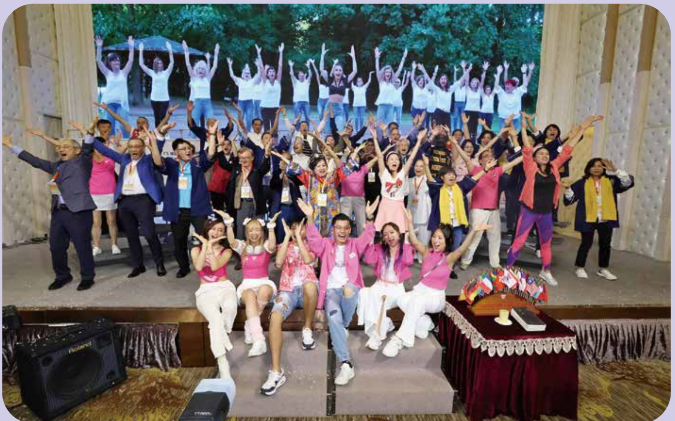
Dancing, Southeast Asia & Sri Lanka Regional Performance