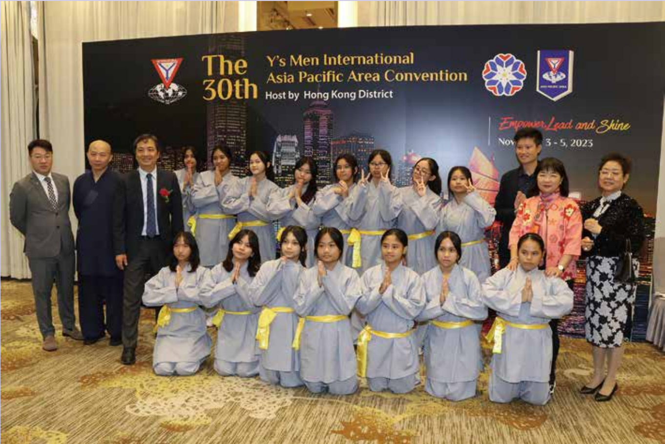
Shaolin Kung Fu Performance