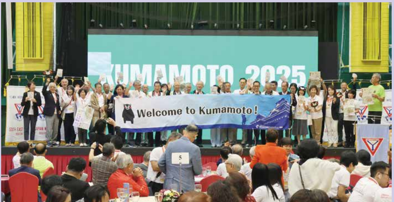
AC2025 Kumamoto, Japan Promotion