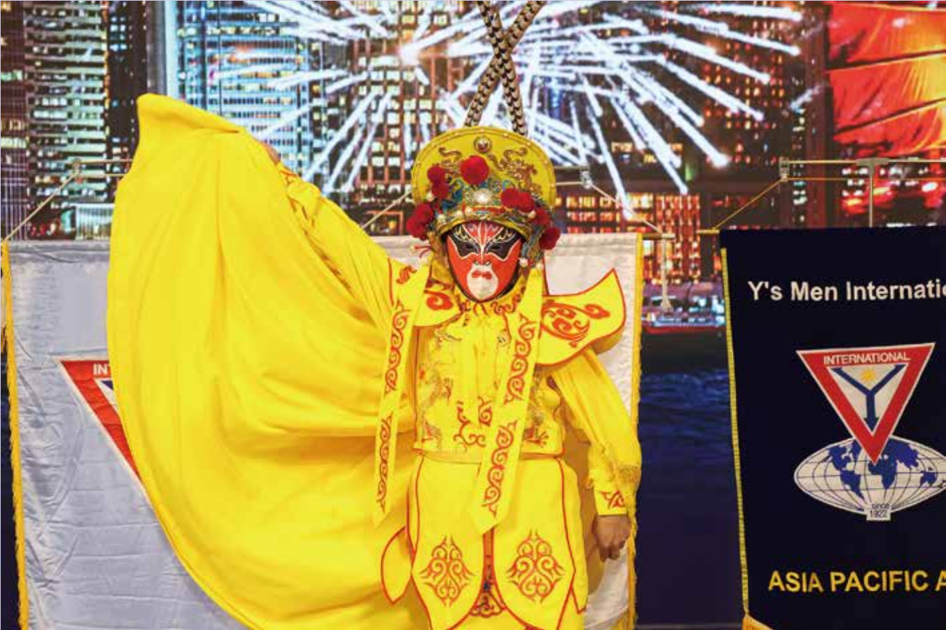
Si-Chuan Face-changing Performance