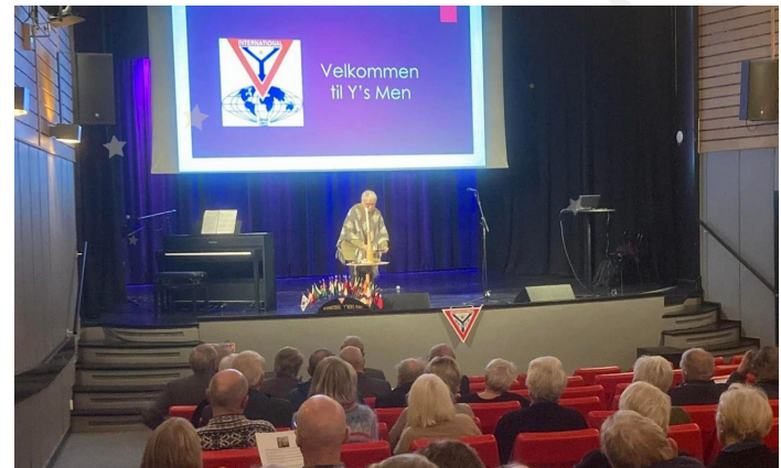
世界で一番、会員数が多いクラブ： ノルウェー・マンダルクラブ