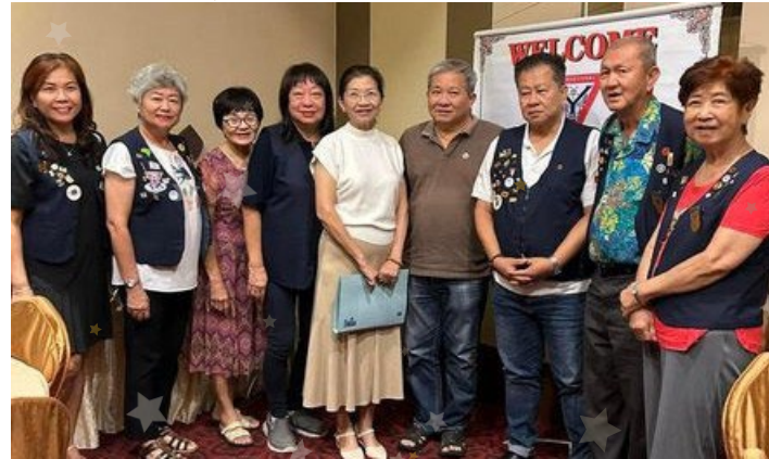
マレーシアのシルバーステートクラブの入会式