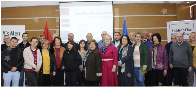
新しい部:デンマーク区・西バルカン部。初の部大会はコンソクラブがホスト