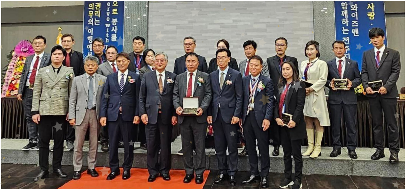
韓国地域・忠北区の全州ムゲンガクラブのチャーター式典