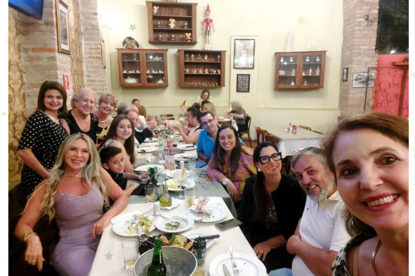
ブラジルのクラブが集まり、新入会員、誕生日を祝いました。