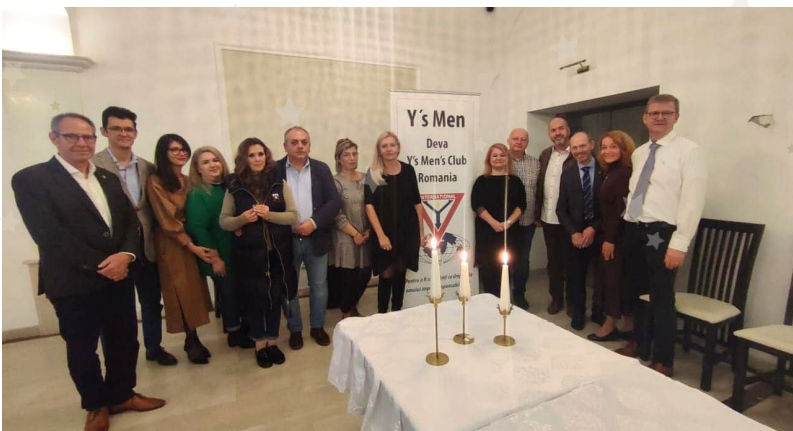
ヨーロッパ地域・デンマーク区、デヴァ・ルーマ ニアクラブのチャーター式典