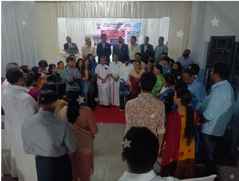
インド地域・中央トラバンコール区、カダムパナッド クラブのチャーター式典