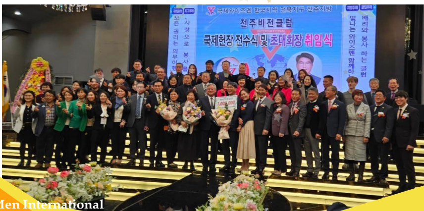
韓国地域・忠北区の全州ビジョンクラブのチャーター式典

Y's Men International Rue de Lausanne 121 CH-1202 Geneva Switzerland www.ysmen.org