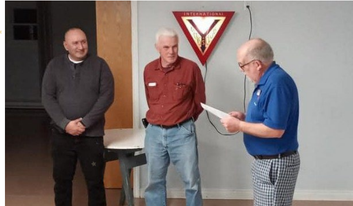
カナダ/カリブ海諸国地域・沿海区、シドニー・リバー ビュークラブの入会式