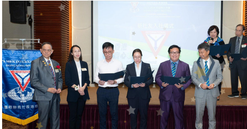
香港のチム・シャ・ツイクラブの入会式