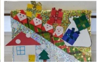
↑クリスマスカード↓