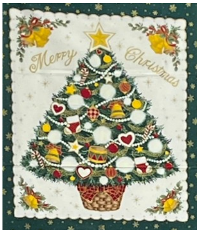
(12/9千葉クラブの例会より)