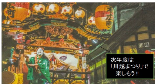
次年度は「川越まつり」で楽しもう!!