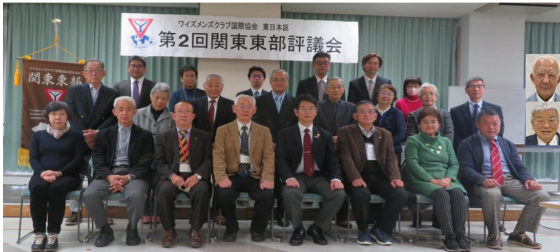
2023.11.18 第2回評議会 於：東陽町コミュニティーセンター