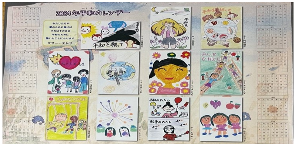
(所沢クラブのCS事業 “平和を守る絵はがきコンクール” の作品より)