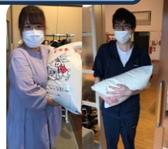
グループホームいろどり ひびき野