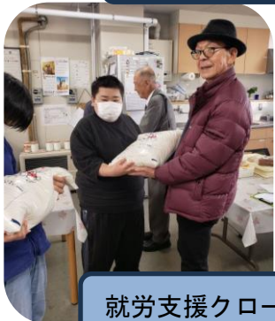
就労支援クローバ