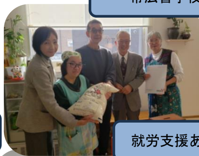
就労支援あがり・框