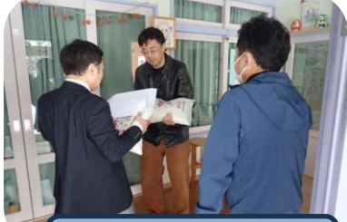
音楽セラピー樹音