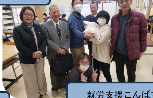
就労支援こんぱす