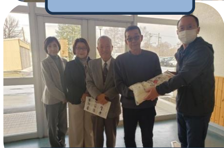
支援施設つつじ・愛灯学園