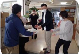
支援施設はちす・慈光学園