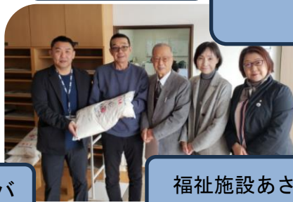
福祉施設あさひ荘