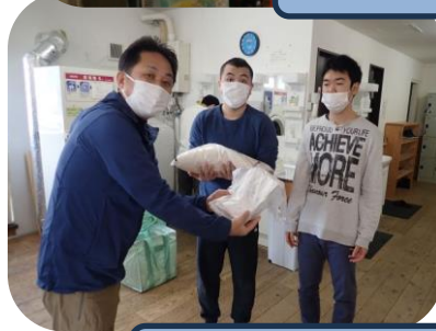
就労支援フリッパー