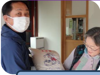
就労支援ゆうゆう