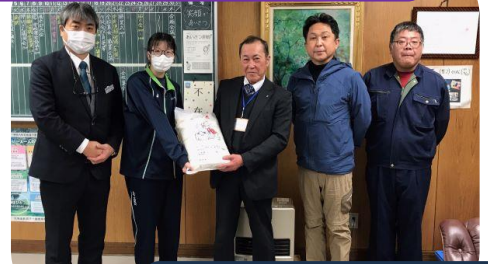
中札内高等養護学校