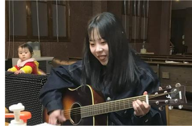
上達著しいチャーリー