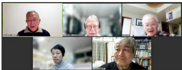
【Zoomで行われた2月第二例会の様様】