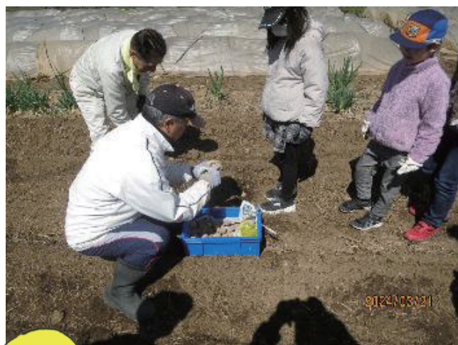
ワイズが種芋を順番に渡すところ