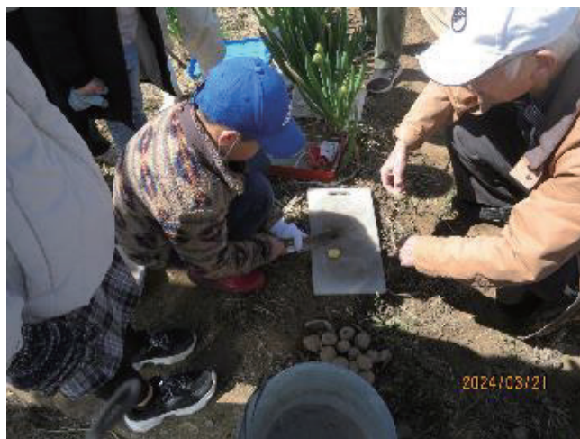
種芋を包丁で切り木灰付け