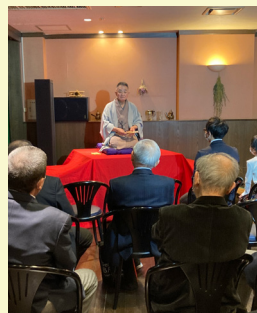
写真は今年の新年例会より