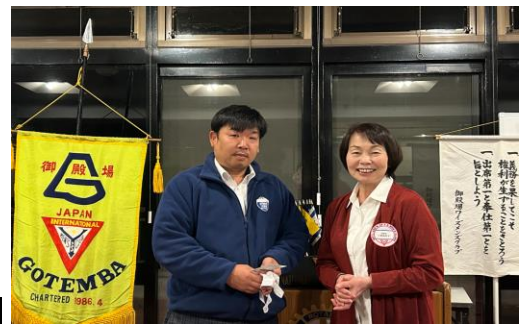
誕生祝い勝間田和彦Y's