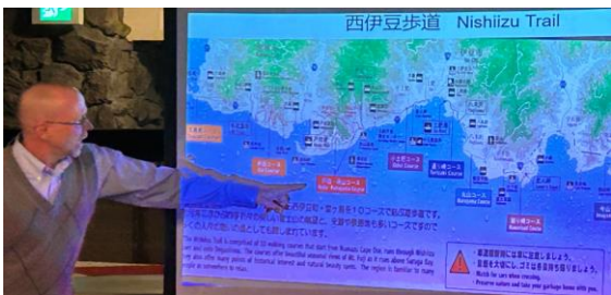
「素晴らしい」伊豆半島に関する知識