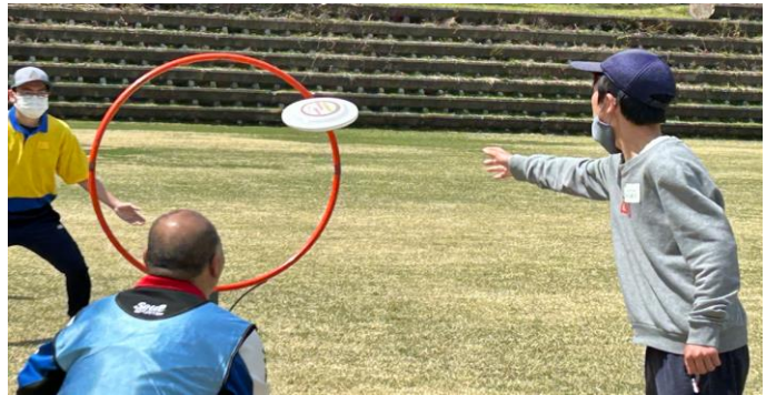
皆さん、とてもかっこよくディスクを飛ばしていました