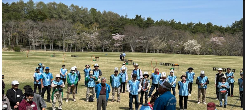
お手伝い内容についての説明を受けるボランティアスタッフ