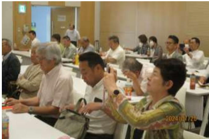
富士山部役員会・評議会の様子

7 月 20 日（土）午前 10 時より沼津プラザヴェルデにおいて第 1 回富士山部役員会・評議会が開催されました。審議事項は、予算案承認の件、部長、各事業主査、各会長の活動方針が承認されました。