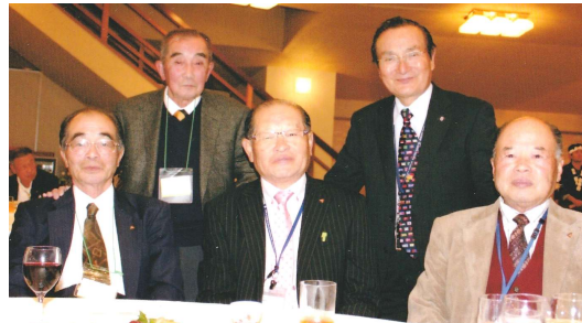
2013.11.24 熱海クラブ50周年記念式典 御殿場クラブの皆さん