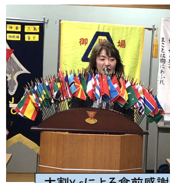
大割Y,sによる食前感謝