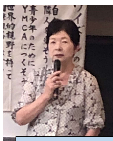
杉山会長あいさつ