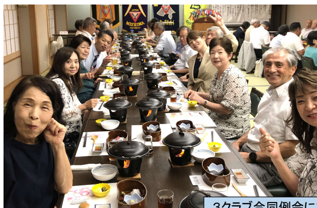
3クラブ合同例会にて