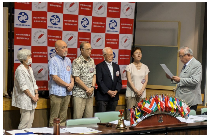
（久保部長司式のもと就任式に臨む今年度役員）

“To acknowledge the duty that accompanies every right”