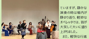
ていですが、静かな演奏の時は場内が静まり返り、軽妙なオペレッタでは、皆が大笑して大いに盛り上がりました。また、軽快な行進曲に合わせて子どもたちが踊る様子もまた、それを楽しみに来てくれる子どもたちもいるようです。