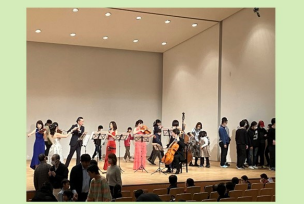
(子ども達も舞台の上で)