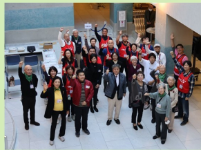
(コンサートを支えるボランティア)