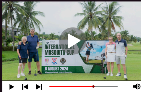
RBM ゴルフトーナメント