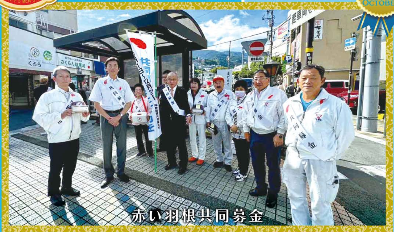
赤い羽根共同募金

熱海クラブ会長主題 『承継と未来に繋げる運営』 Succession to the future 副題『Enjoy Y's』