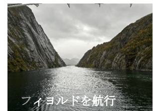
フィヨルドを航行