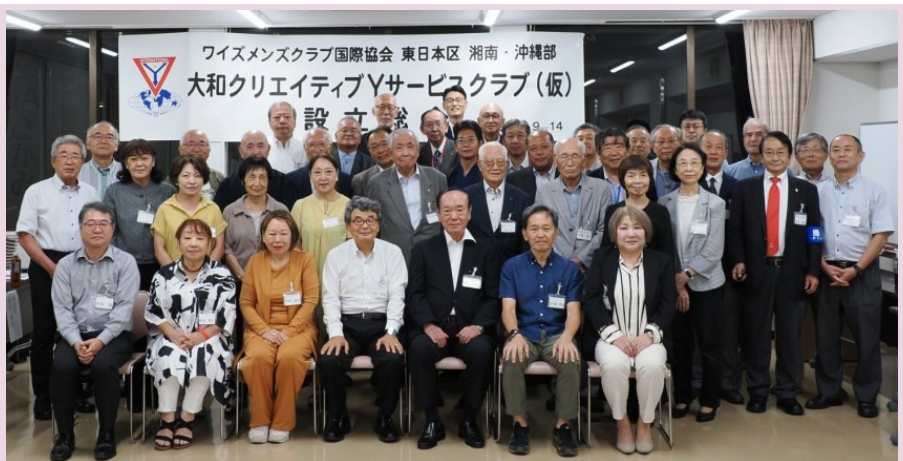
（写真は設立総会のもの。田中博之ワイズ提供）