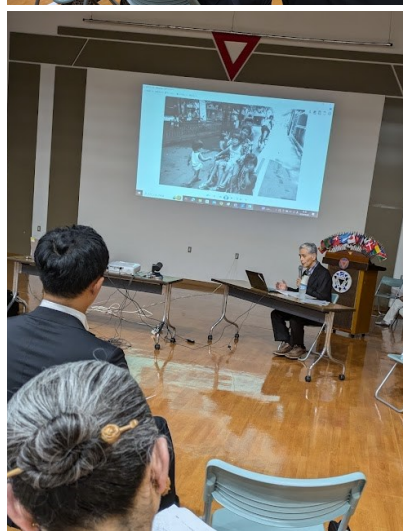
右上：ハーブの音色にうっとり！ 左上：第28回東日本区大会@宇都宮のアピール 左下：益巖先生の卓話

“To acknowledge the duty that accompanies every right”