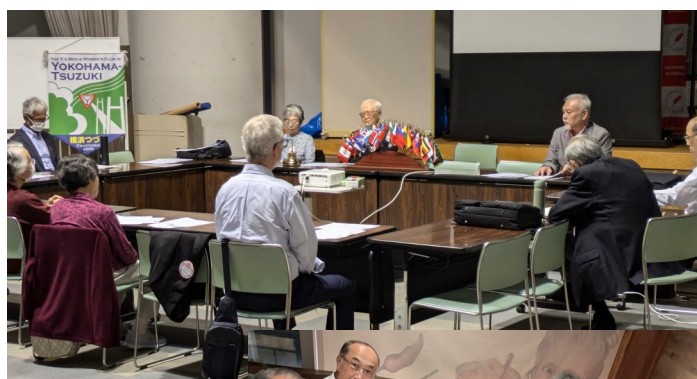
↑ 例会風景 →ゲストも交 えての懇親会 食会