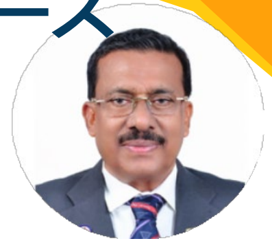
A・シヤナバスカーン 2024/2025国際会長