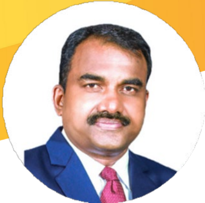
国際書記長 ジョース・ヴァルギース