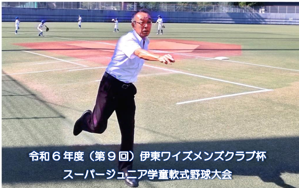
令和6年度(第9回)伊東ワイズメンズクラブ杯 スーパージュニア学童軟式野球大会

御言葉を行なう人になりなさい。 自分を欺いて、聞くだけで終わる者になってはいけません。 ヤコブの手紙 1章 22節