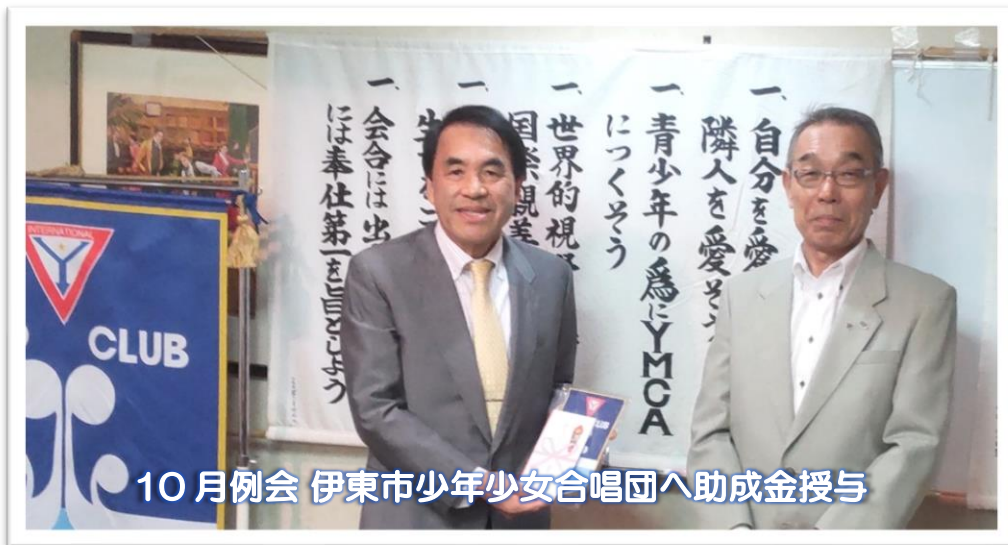
10月例会 伊東市少年少女合唱団へ助成金授与

現在の苦しみは、将来わたしたちに現されるはずの栄光に比べると、 取るに足りないといわたしは思います。 ローマの信徒への手紙 8章 18 節