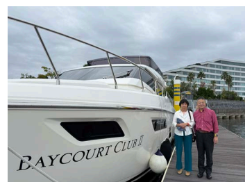
最近の結婚34周年記念旅行のときの写真