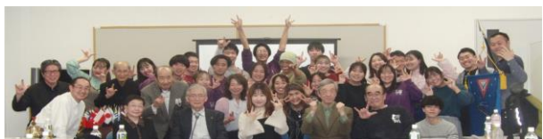
過去最大人数の例会？これはすごい！

今回の例会で、2カ月連続で開会点鐘をゲストのリーダーが行いました。今回はチャーリーです。先月のペペの点鐘を見て、私もやりたいと申し出がありました。今月はなんと20名のリーダーが集まってくれました。卓話が「フリー」だからでしょう。中国人留学生のフリーはすっかりYMCAに溶け込み、みんなの人気者です。さわやかな女の子です。