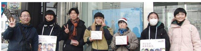
大通りミスタードーナツ前