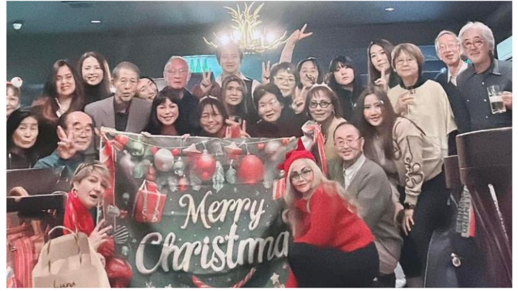
メリークリスマス、素晴らしいパーティでした。

がりの余韻を残して店をでました。この日は募金活動と教会の昼食会、ギター演奏、実にぎっしり詰まった充実の1日です。ありがとうございました。