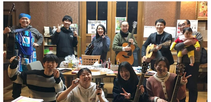
仕上がりは上々、今回は期待してください

2月来る3月2日のリーダー卒業式で披露する、ギター同好会の演奏。「また会える日まで」の最終合同練習が27日行われ、見事に完成しました。当日の演奏が楽しみです。