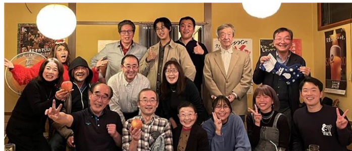
本当にみんな楽しそうです。メリークリスマス。

今年もクリスマス例会を開催できてよかったと心から思いました。クラブの長老、大関メンと井上メン、体調の回復をこころより願います。