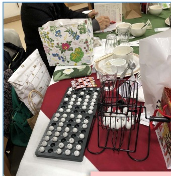
ビンゴゲームとプレゼント交換