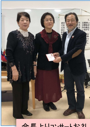
会長よりコンサートお礼