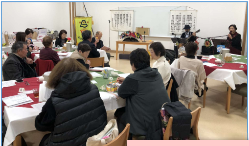
みんなで聴き入って