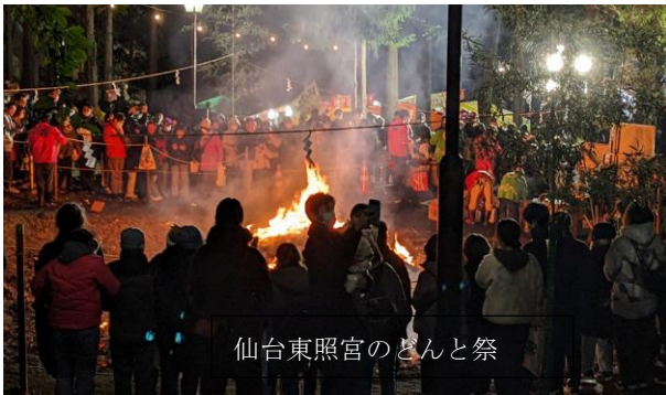
仙台東照宮のどんと祭

2025年は、大きな変革の現れる年となりそうです。政治的には、米国で政権交代がありました。インターネットでは、大災害の「予言」が溢れています。ある神道の教主は「今年乙巳(きのえ・み)に当たる。この年は大化の改新など、大きな変革が起こりやすい」と語っていました。煽られることなく、その先(せん)を取ることができるように、丁寧に日々を過ごしたいと思います。(川上)