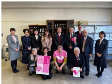
YMCAこども園、ホテル専門学校でのアピールの模様