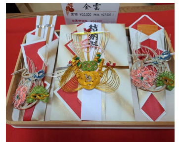
光永家より、婿を出します。