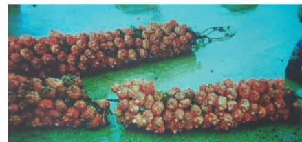
水揚げした養殖の「ほや」

「ほや」は動物です。脊索動物門の尾索動物亜門に分類されます。人間は脊椎動物亜門に属しています。人間の仲間です、かわいがってください。体は植物と同じセルロースを主成分とする殻に包まれています。殻は、スピーカーのコーン紙の材料に使われたりしていました。雌雄同体ですが、1匹で子孫を残せません。実験で証明されています。自分と他人をはっきり見極めています。海のパイナップルと言われていますが、見た目も味も全く違います。「ほや」の養殖ですが、細いロープに小さな「ほや」をくっつけて、大きなロープに巻き付けて海に沈めます。