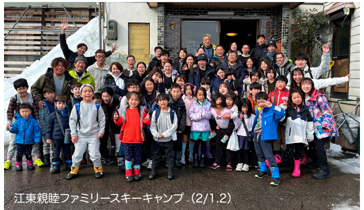
江東親睦ファミリースキーキャンプ (2/1,2)