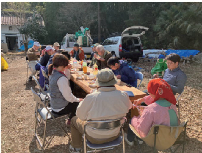
< 銀河鉄道の森 昼食風景 2025.02.16 >