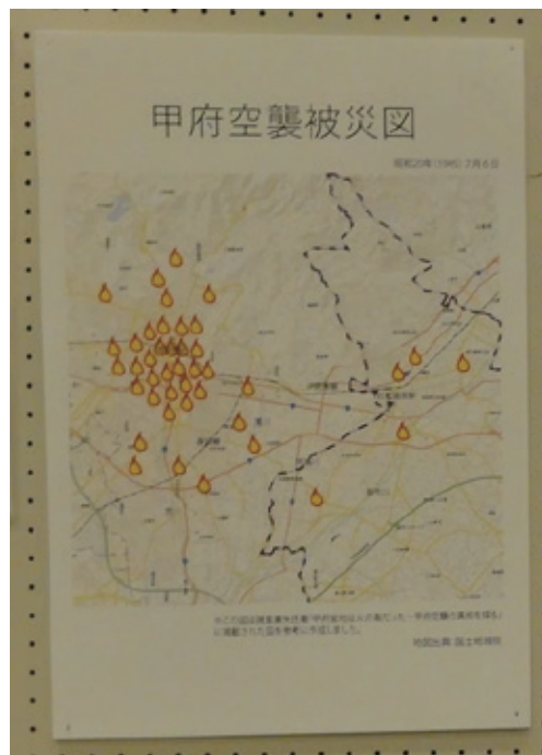
平和ミュージアム資料より

空襲の状況：日本側から東部軍管区司令部、大本営、米国側は米国国立文書館に保管されている。ニューヨーク・タイムスも報道している。