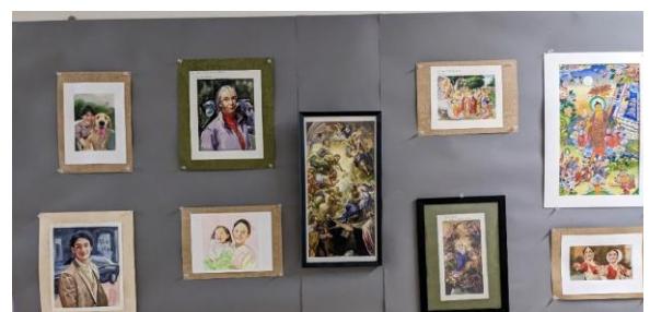
↑ ホテル専門学校ビジャイ君作品