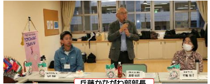
兵藤かながわ部部長