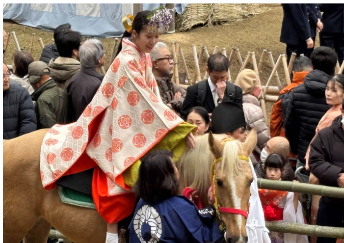
※写真は春日若宮御祭の馬に乗るみかんこ（舞姫）