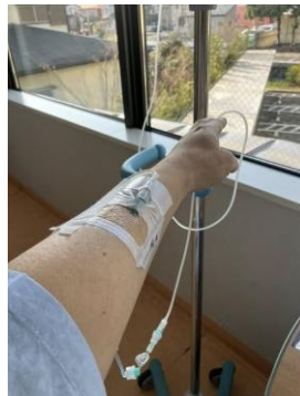
入院初日から退院前日まで付けられていた点滴

手術の翌日、つまり3月19日は一日中、その状態。目が覚める。痛みを耐えながらトイレに行く。痛み止めを点滴に入れてもらう。しばらく眠る。しかし、夕方になると看護師さんから、動かないとイレウス(腸閉塞)になるのでリハビリとして歩いてくださいと言われる。イレウスになると、再手術、入院期間も延びるので、それは嫌なので歩く。とはいえ、最初は20メートルくらいの廊下を一往復、点滴スタンドをシルバーカー代わりにゆっくりゆっくり歩いて、痛みで断念。2回目は3往復で断念。ほとんど、ベッド上で寝返りも打てず、全く動かずに過ごす。