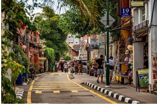
多文化が共生するペナンの街並み