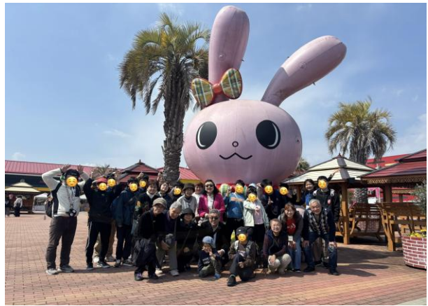
こんにやくパーク、イメージキャラクター『マナンちゃん』の前で記念撮影