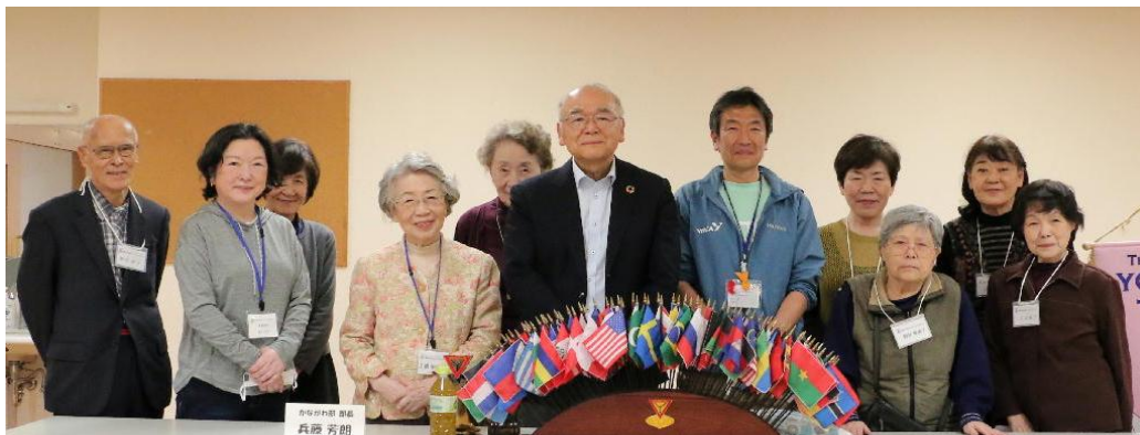
2026.4.9 つるみクラブ例会