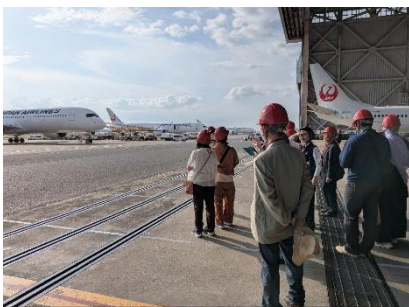
次々と飛び立つ飛行機にくぎ付け