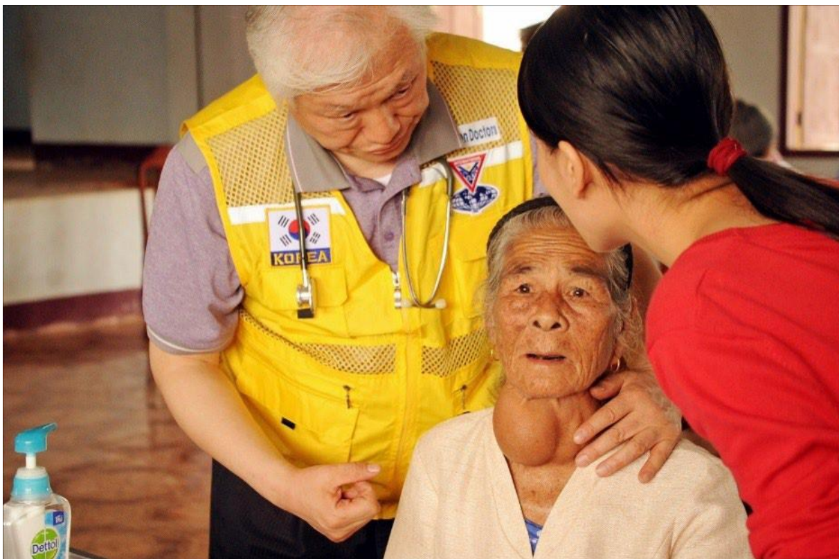
YMIドクターのラオス訪問 (2019)