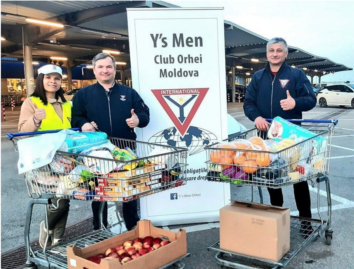
ウクライナへの緊急支援 (2019)