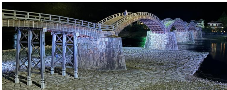
錦帯橋ライトアップです。祝会の後に撮影しました。

ちなみに2015年に岩国で交流訪問をした際の写真を熊本みなみクラブのメンよりみせていただいた時には胸が熱くなりました。出会いの大切さを改めて思い知らされた会でした。