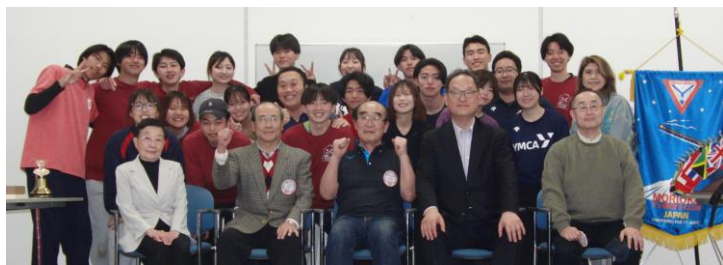
大人数の集合写真皆様ありがとうございます。