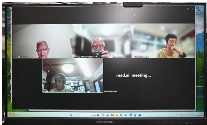
【5月第二例会のZoom画面】