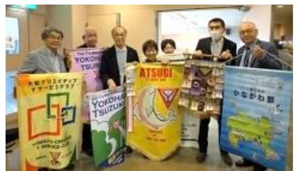
石巻パナーセレモニー出場前 かながわ部