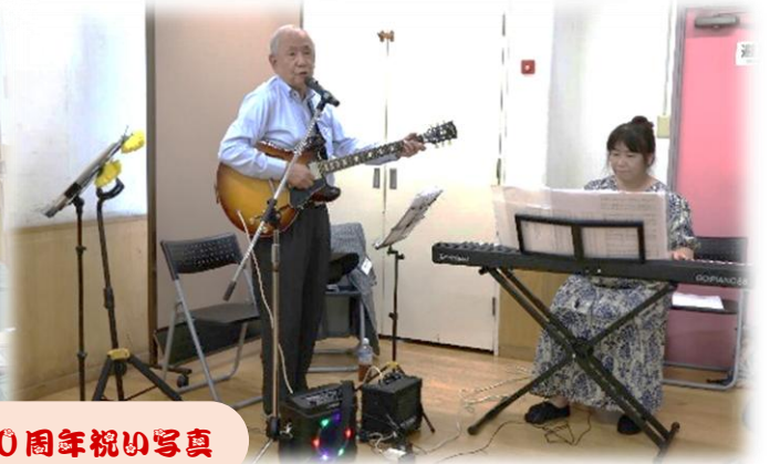
つづきクラブ20周年祝い写真