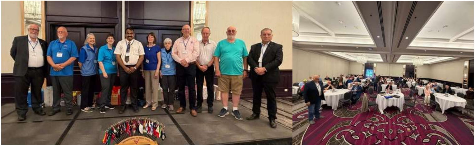
カナダ、フレデリクトンで開催された第75回マリタイムズ区大会