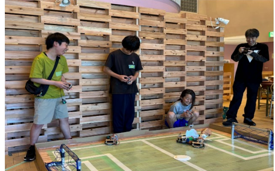
写真は VIVISTOP Waku Ville でロボットを使ってサッカーを楽しんでいる子供たち