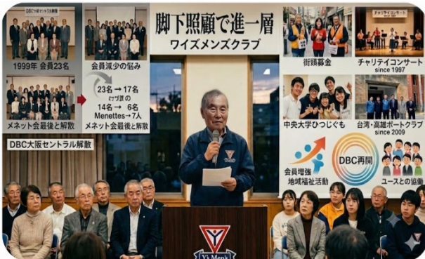
久保田年度 キックオフ例会

しかし、ワイズ活動は人数が減少したものの中央大学ひつじくもとの交流は2001年から続き、街頭募金やチャリティコンサートは1997年から毎年継続しており、台湾の高雄ポートクラブとのIBCも2009年から相互に交流を継続しています。継続は力なりとして、今期もユースとの協働、チャリティコンサート、IBC関係に他クラブとの交流は積極的には継続して行きたいと思ひます。DBCも持ちたいと思ひています。加えて、会員増強により、地域の福祉活動や他の団体との交流も考えていますのでクラブの会員全員のご努力とご協力をお願いする次第です。